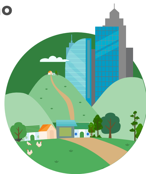
RTH Municipal - Carbono