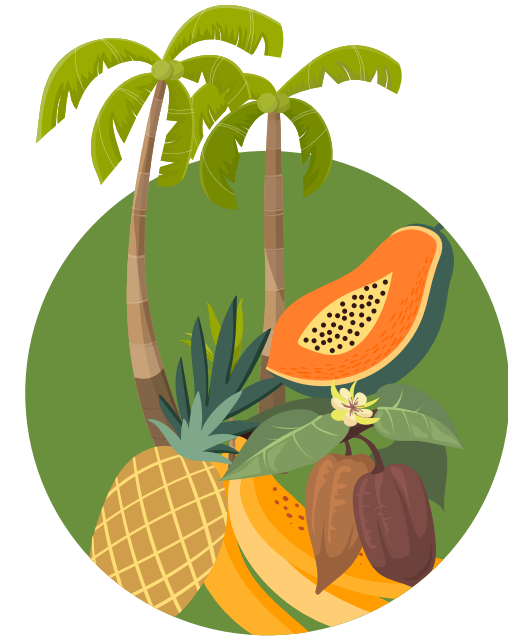
RTH Productos - Carbono

¿Cuáles son los Programas Nacionales de Gestión de GEI?